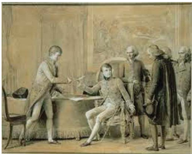
חתימת הקונקורדט ע"י נפולאון

ממלכתית או בקביעת יום השבת כיום שבתון. היא תקבע אך ורק עפ"י התנהגותם האישית והלאומית של אזרחיה ומנהגיה. אפשר לחיות עפ"י החוק או עפ"י ההלכה, ואפשר גם עפ"י שניהם יחד, אבל הברירה החופשית האמיתית בין שתי השקפות העולם תהיה אפשרית אך ורק אם כל צד יכבד את דעתו של השני. הדו-שיח יהיה אפשרי ופורה רק כאשר לכל צד תהיה עצמאות כלכלית וחברתית שתאפשר לו להביע את עמדתו. אז ורק אז, יוכלו אזרחי מדינת ישראל לקבוע באמת את אופייה של המדינה ואת המשך קיומו של עם ישראל. עמדת ההלכה תחזור ותשמע בישראל אך ורק כאשר הרבנות תחדל להיות יחידת סמך במשרד ראש הממשלה, וה-GOV יפנה את מקומו ל-CO, שנאמר, כה אמר ה'.